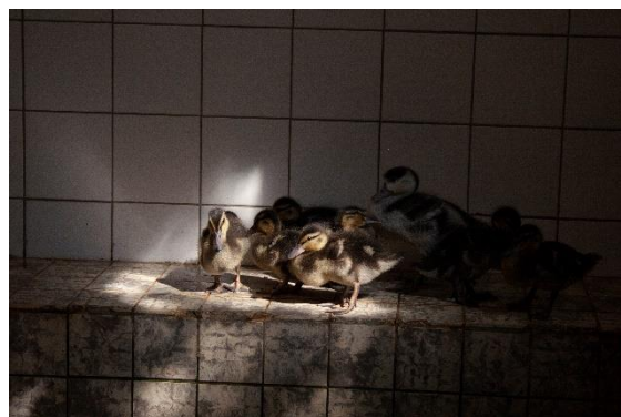
Figuur 5 Jonge eenden in de binnenvijver, zie toelichting foto's voor meer info

De VOU maakt sinds 2015 gebruik van de dierenambulance die Stichting Dierenlot ter beschikking gesteld aan de VOU. Deze dierenambulance maakt het mogelijk om de vogels op een verantwoorde manier te vervoeren naar de loslaatplaatsen. Ook het vervoer van roofvogels en watervogels naar gespecialiseerde en bevriende opvangcentra kan nu diervriendelijker gebeuren. Hierdoor stijgen de overlevingskansen van deze vogels. Inmiddels is ook een speciale bakfiets voor lokaal dierenvervoer toegevoegd aan het wagenpark.