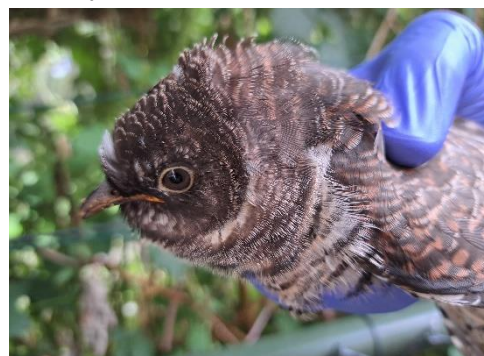
Figuur 2 Koekoek, zie toelichting foto's voor meer info

In 2023 is de ontwikkeling van onze sociale media verder vormgegeven. Inmiddels zijn er ook vrijwilligers gevonden om de sociale media te onderhouden en steeds weer te voorzien van relevante informatie. Daarnaast is er een Instagram account actief.