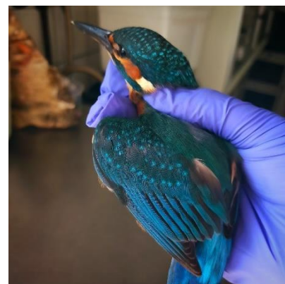
Figuur 1 Ijsvogel. Zie toelichting vogels voor meer informatie.