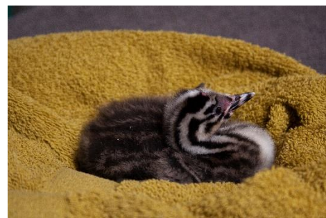
Figuur 3, jonge fuut Zie toelichting foto's voor meer informatie.

Er wordt intensief samengewerkt met Vogelopvang Soest en Vogelhospitaal Naarden. Vogelhospitaal Naarden heeft een deel van de onze vogels overgenomen toen wij het tijdelijk niet aankonden. We zijn Soest en Naarden erg dankbaar voor hun ondersteuning in 2023.